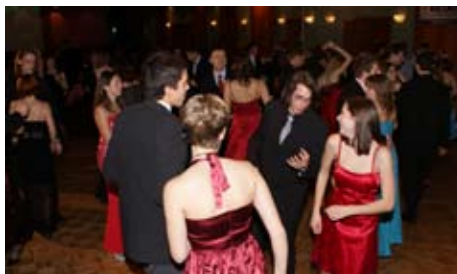
Ples FEKT a FIT