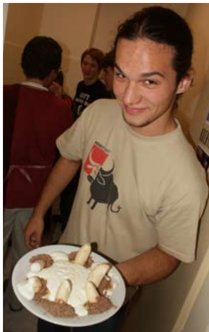
Banánový dezert pripomínajúci, ehm...

Počet porcií: sa nedá odhadnúť, regulérne počet banánov × 2, ale kebyže nemám ingrediencie pod zámkom, tak by to aj tak zožrala všetko tá 1 osoba.