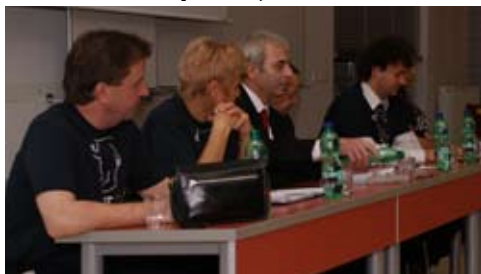
Setkání s vedením