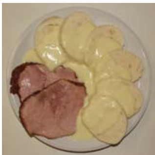
Křenovka s uzeným a s šesti :-)

1,4 kg uzeného masa (krkovice nebo plec), 0,5 kg brambor, středně velký křen (asi 200 g), 2 ks přílohových knedlíků, zeleninová směs do polévky, olej, 6 kostek bujonu (např. slepičí), smetana, olej, sůl, pepř, drcený kmín, trocha hladké mouky na zahuštění.