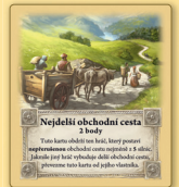
Nejdelší obchodní cesta